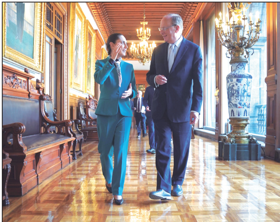
Claudia Sheinbaum P. y Larry Fink.

alrededor de lo mismo. Que si su poder de voto en empresas es excesivo, que si su tamaño ahoga la competencia, que si hay conflictos de interés porque asesora aquí y también invierte allá, que si en crisis financieras ha tenido un papel demasiado “cerca del poder” como para llamarlo casualidad. Y luego está el capítulo de la virtud corporativa: durante años se vendió la idea de que empujaría a las empresas a comportarse mejor con el planeta y la gente, pero en la práctica el equilibrio entre principios y ganancias siempre termina pareciéndose mucho a lo segundo. Cuando conviene, se habla “de dientes para afuera” de responsabilidad; cuando aprieta el ambiente político o los mercados se ponen nerviosos, se redescubre el viejo amor por la “neutralidad”.