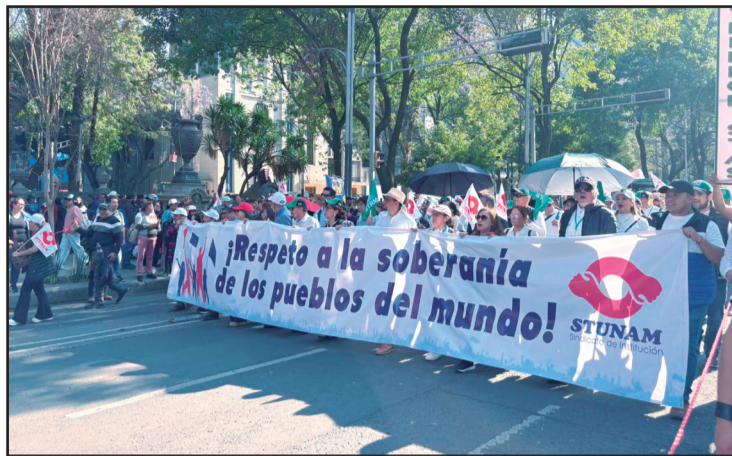
El STUNAM durante la movilización del 18 de marzo.

de Trabajadores de la Educación (CNTE) que realizó un paro de labores de 72 horas el 18, 19 y 20 de marzo. Esta acción que desarrolla una forma importante de lucha, como es el paro de labores, y al haberse llevado a cabo en varios estados del país, es en sí mismo un hecho de primera importancia para la lucha de los trabajadores. Además, que la demanda central es la abrogación de la Ley del ISSSTE de 2007, demanda que afecta no solo al gremio educativo, sino a todos los del sector público derechohabientes del ISSSTE.